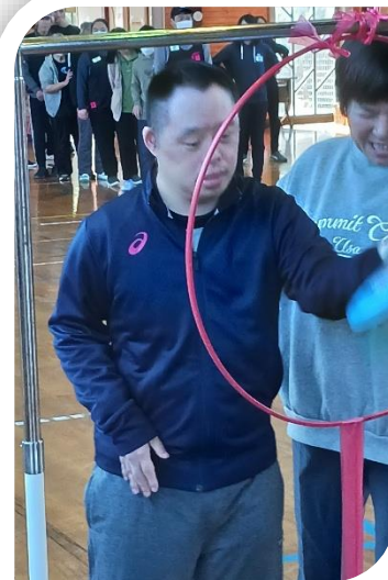
アキュラシー、フリスビーの盤を輪の中に投げ入れます