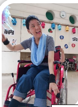
7 月 納涼会