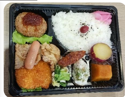
やはり1番のお楽しみ みはお弁当！