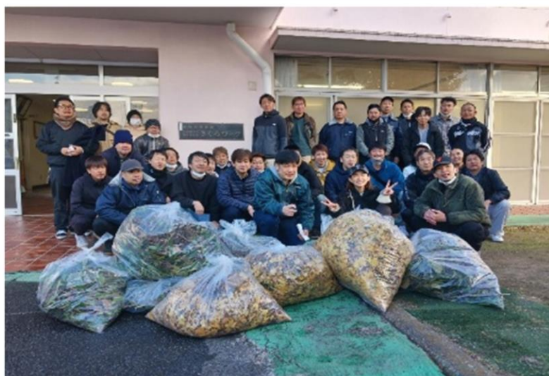
12 月 年末の恒例行事 ジャココ社員の皆様の勤労奉仕。